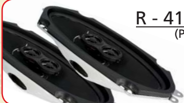
R - 413N (Paar)