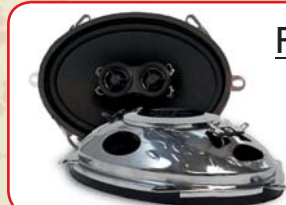
R - 573N (Paar)