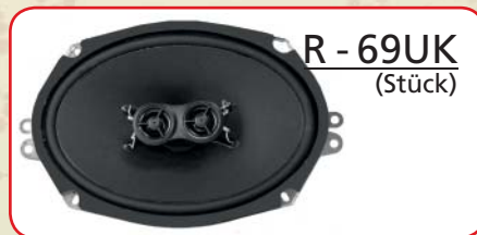
R - 69UK (Stück)

Bauart Bauart 2-Wege Nennimpedanz 4 + 4 Ohm Frequenzgang 40Hz - 21kHz Schalldruck 90dB Dauerleistung 100 Watt Spitzenleistung 200 Watt