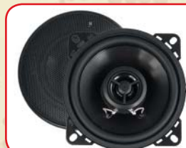
R - 452N (Paar)