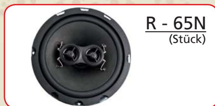
R - 65N (Stück)

Bauart Bauart 2-Wege Nennimpedanz 4 + 4 Ohm Frequenzgang 52Hz - 21kHz Schalldruck 87dB Dauerleistung 50 Watt Spitzenleistung 100 Watt