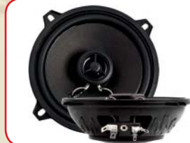
R - 525N (Paar)