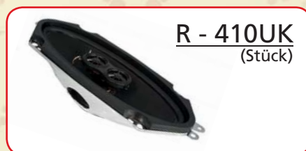
R - 410UK (Stück)

Bauart Bauart 2-Wege Nennimpedanz 4 + 4 Ohm Frequenzgang 43Hz - 21kHz Schalldruck 87dB Dauerleistung 90 Watt Spitzenleistung 160 Watt