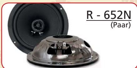
R - 652N (Paar)

Bauart Bauart 2-Wege Nennimpedanz 4 Ohm Frequenzgang 52Hz - 21kHz Schalldruck 87dB Dauerleistung 50 Watt Spitzenleistung 100 Watt