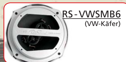
RS - VWSMB6 (VW-Käfer)

Bauart Aus Hochstabilen Stahl gefertigt und zur Aufnahme vom mitgelieferten RETROSOUND R65N 16cm Koaxiallautsprecher gedacht. Diese Lautsprecheradapter sind passend für den Volkswagen Käfer vom Baujahr 1958 bis 1967.