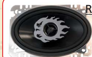
R - 463N (Paar)