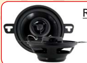
R - 352N (Paar)