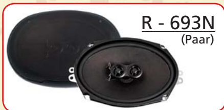
R - 693N (Paar)

Bauart Bauart 2-Wege Nennimpedanz 4 Ohm Frequenzgang 40Hz - 21kHz Schalldruck 90dB Dauerleistung 20 Watt Spitzenleistung 30 Watt