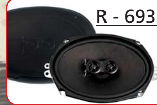
R - 693N Slim-Line (Paar)