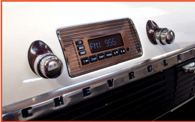
Radio „Model One C“ mit Blende RS-4753CHVYTRKT