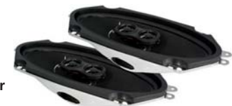
RetroMod 100 x 254mm 80 Watt pro Lautsprecher