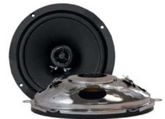
RetroMod 165mm 100 Watt @ 2-Wege Lautsprecher